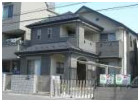
木造 2階建 外壁 サイディング張 屋根 瓦葺 竣工 平成 19年 4月