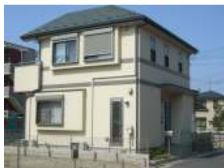
木造 2階建 外壁 サイディング張 屋根 瓦葺 竣工 平成 18年 7月