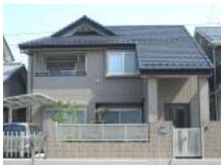
鉄骨造 2階建 外壁 タイル張 屋根 瓦葺 竣工 平成 18年 7月

足立店より約1km位の場所に、東京都施工により54.4haの規模で区画整理事業が行われており、当社にて3棟注文住宅を施工しました。左の写真は鉄骨造で、屋根は入母屋・外壁はタイル張りで重厚感のある建物です。真中と右の写真は木造で、内部は結露防止のため樹脂サッシを使うなど、とても機能的な造りになっております。今回お施主様の勤務先が同じ職場で、ご紹介頂き工事を請け負い致しました。また今後とも信頼を頂けるようがんばります。 足立店 営業部 小橋